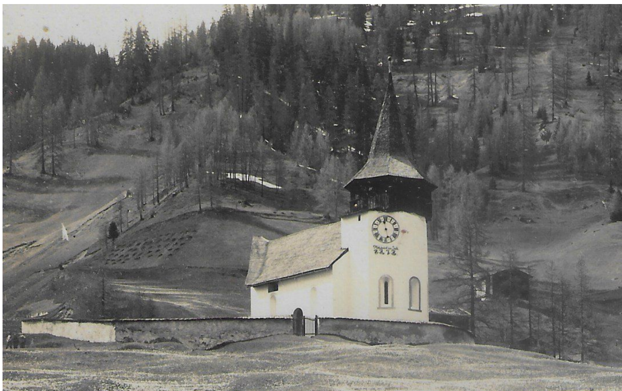
Die Frauenkirche noch mit der 1950 ersetzten Uhr. Ausschnitt aus einer alten Postkarte.